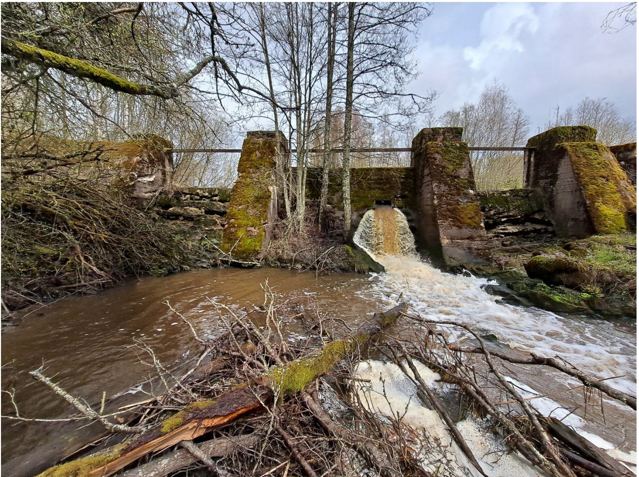
Kuva 1. Aneriojoen Holstenkosken vanha pato.