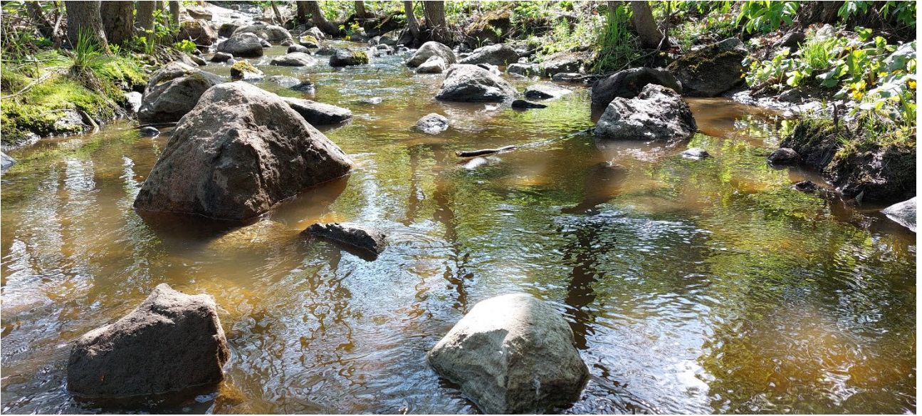
Kuva 2. Kunnostettua Kuninkojaa Suikkilan kaupunginosassa.