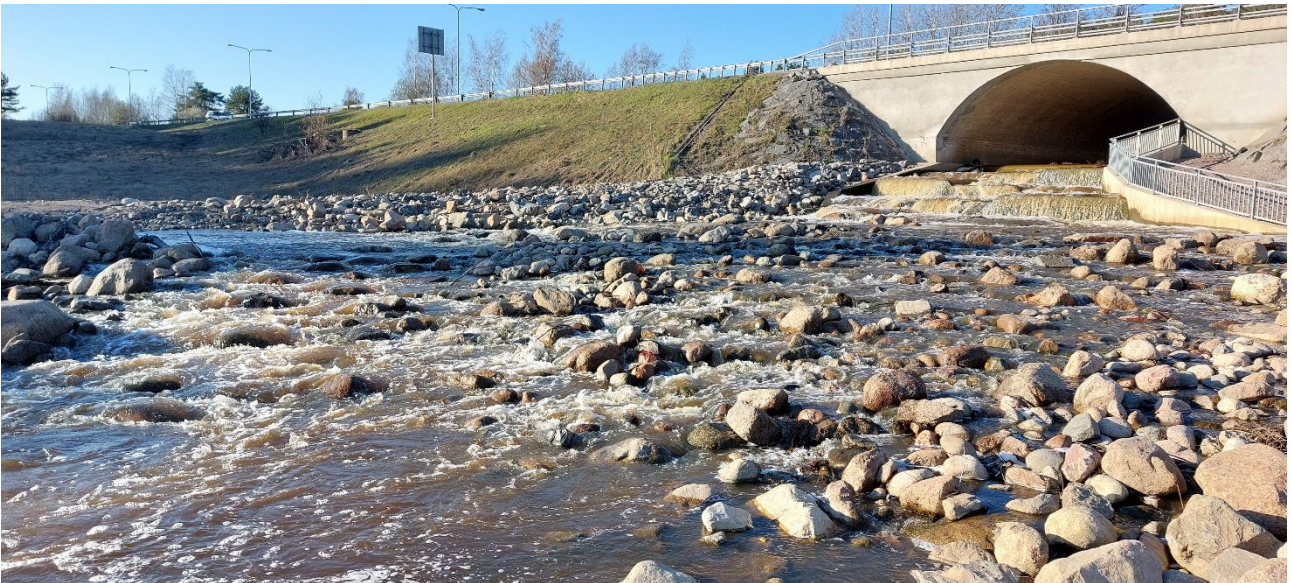
Kuva 4. Raisiojoen Huhkonkosken kalatie valmiina.