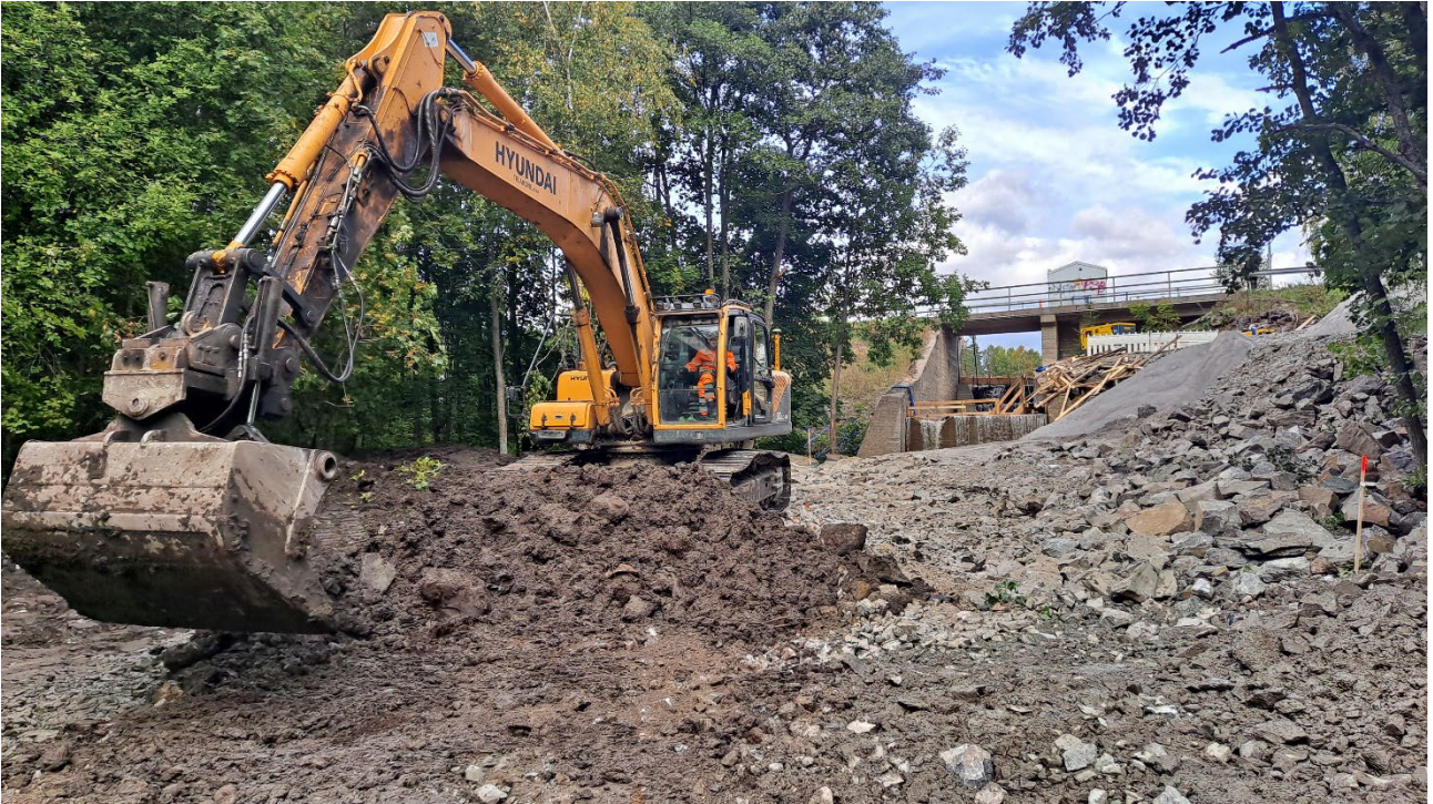
Kuva 3. Raisiojoen Hintsan kalatien rakentaminen käynnissä.